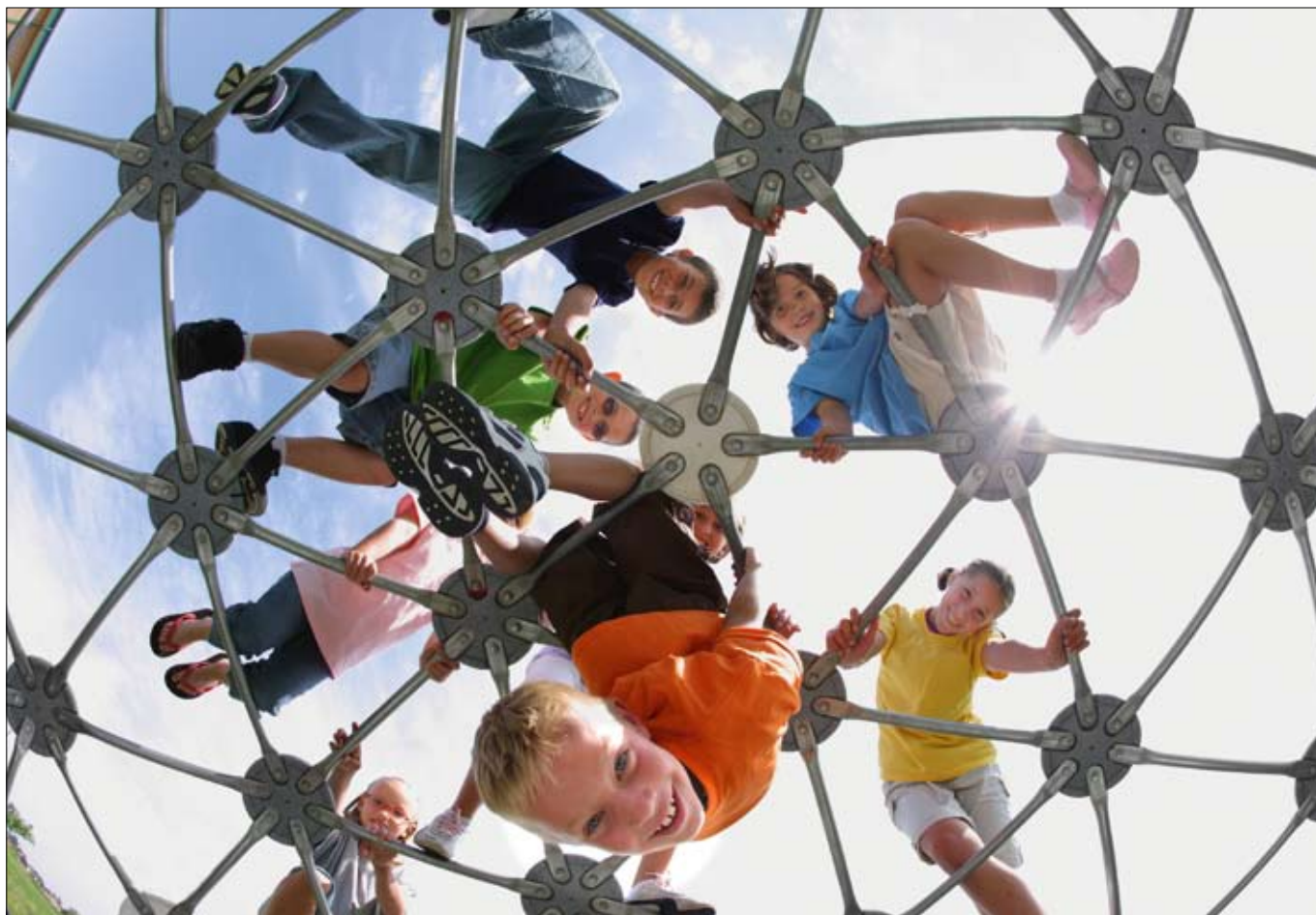
Netzwerk für die Sicherheit: Die bfu-Sicherheitsdelegierten engagieren sich auf Kinderspielflächen

Die bfu hat auf ihrer Website www.bfu.ch die Rubrik «Sicherheit in den Gemeinden» geschaffen. Dort erhalten Sie weitere Informationen. Im elektronischen Verzeichnis finden Sie zudem die für die jeweiligen Gemeinden zuständigen Sicherheitsdelegierten.